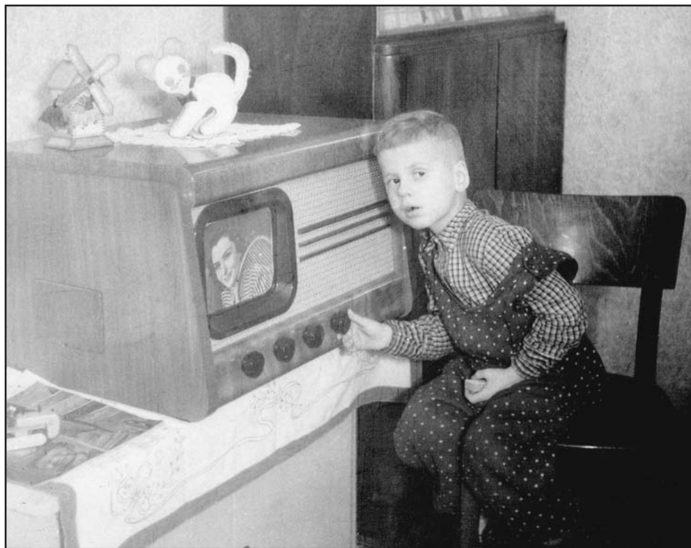
V roce 1956 byl televizor velkým zázrakem nejen pro malého kluka

V r. 1977 odsouzen za nedovolené ozbrojování k 9 měsícům nepodmíněně plus 2 a půl roku podmíněně. Rehabilitován v roce 2005.