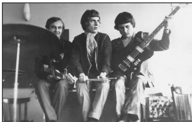
Rok 1970 - zasažen bigbeatem. Uprostřed formace Spektrum.

Nejmladší člen Konfederace politických vězňů, čestný občan města Přerova, držitel medaile J. A. Komenského.