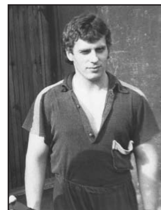
Rok 1983 - fyzicky připraven na dlouhé výslechy StB