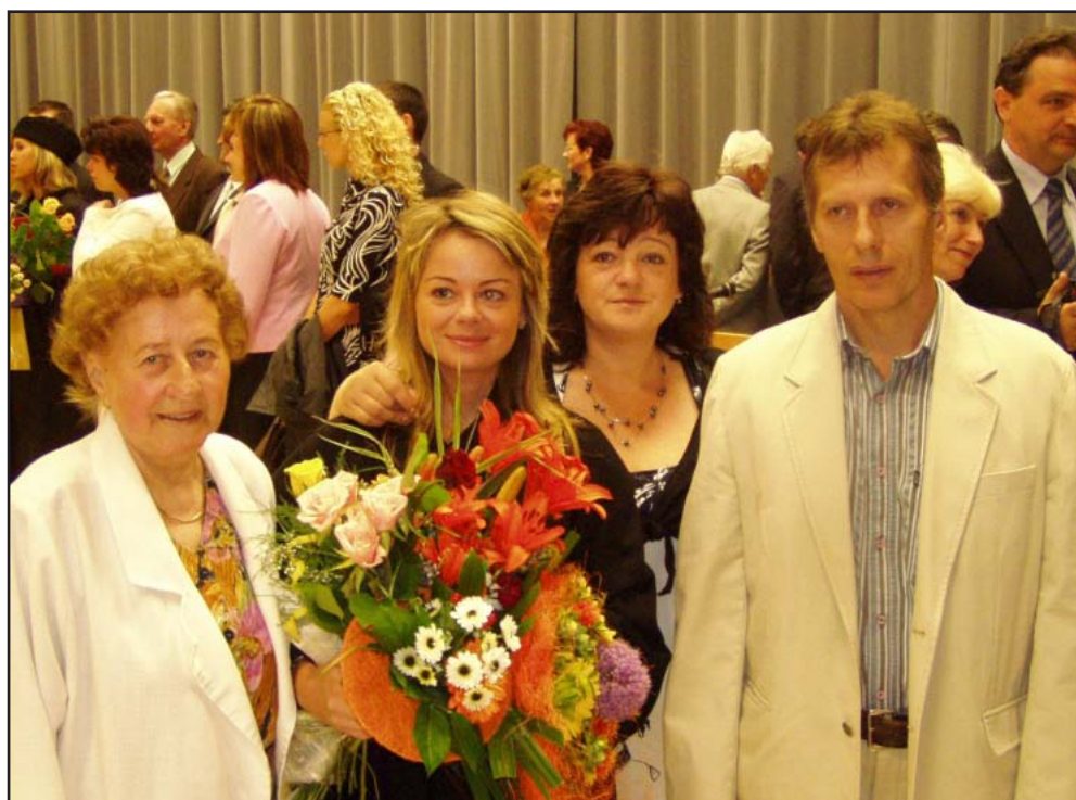
Dceřina promoce, Olomouc rok 2007